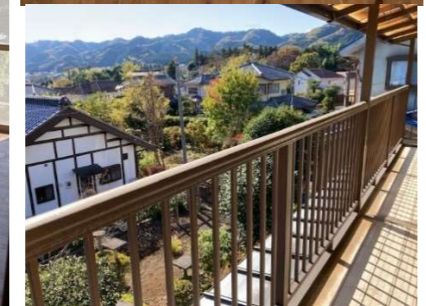
眺めの良いベランダ