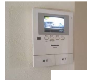
モニタ付インターホン