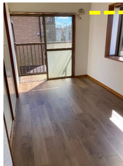
フローリング張替